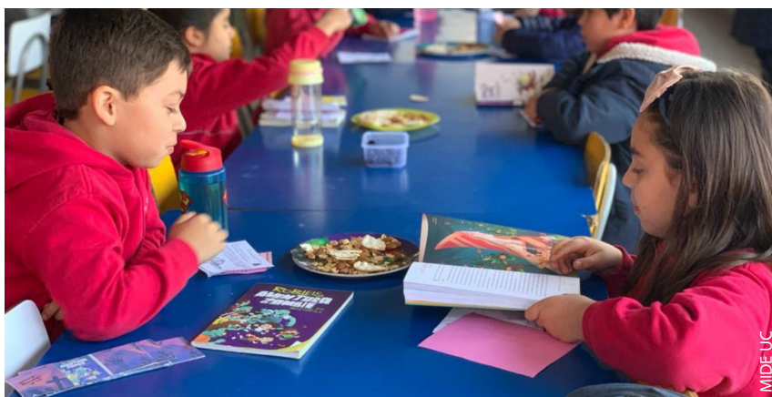
Estudiantes en la actividad de jugo o zumo literario.