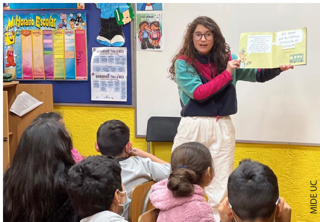
Estudiantes de primaria en una actividad de lectura en voz alta.

En otras ocasiones, en cambio, la lectura del libro puede ser realizada de manera conjunta y compartida dentro del aula. A continuación se describe una actividad que puede ser llevada a cabo para realizar una lectura de este tipo.