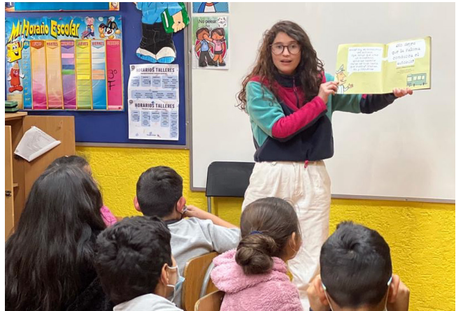
Estudiantes de Primaria en una actividad de lectura en voz alta.

En otras ocasiones, en cambio, la lectura del libro puede ser realizada de manera conjunta y compartida dentro del aula. A continuación se describe una actividad que puede ser llevada a cabo para realizar una lectura de este tipo.